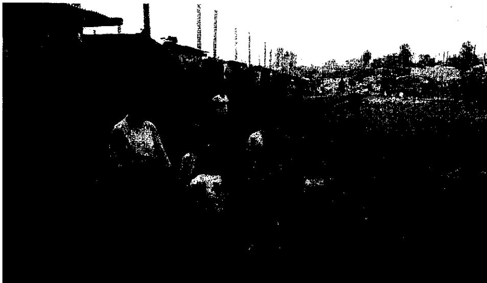
La ciudad de plástico. Esteli, Nicaragua