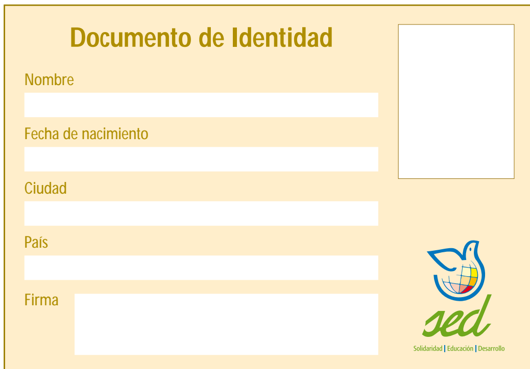
Foto o dibujo de nuestra cara.